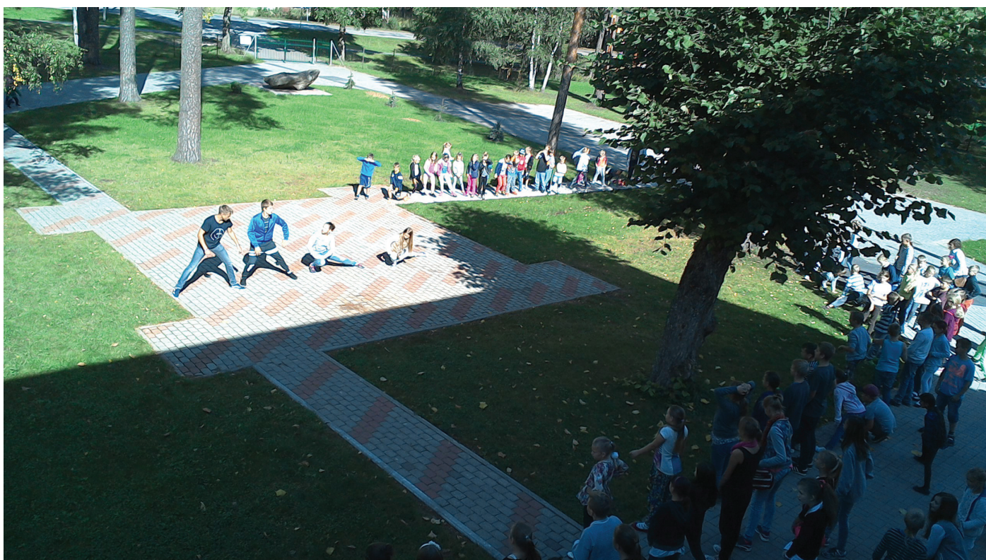
Skatīties video: https://www.youtube.com/watch?v=568llytQJsQ